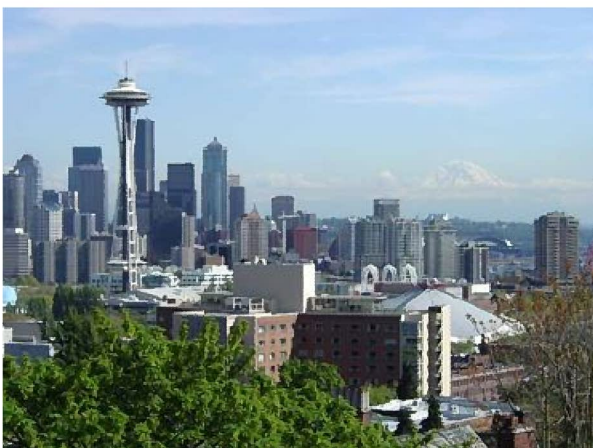
シアトルの街並み