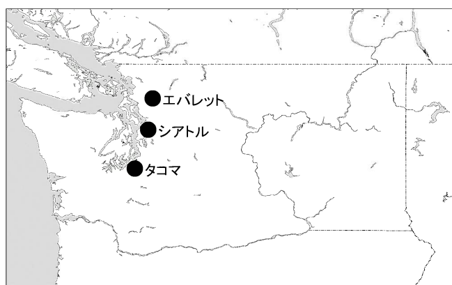
シアトル都市圏を代表する3都市