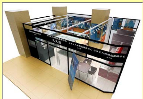
大連チャレンジショップ鳥瞰図