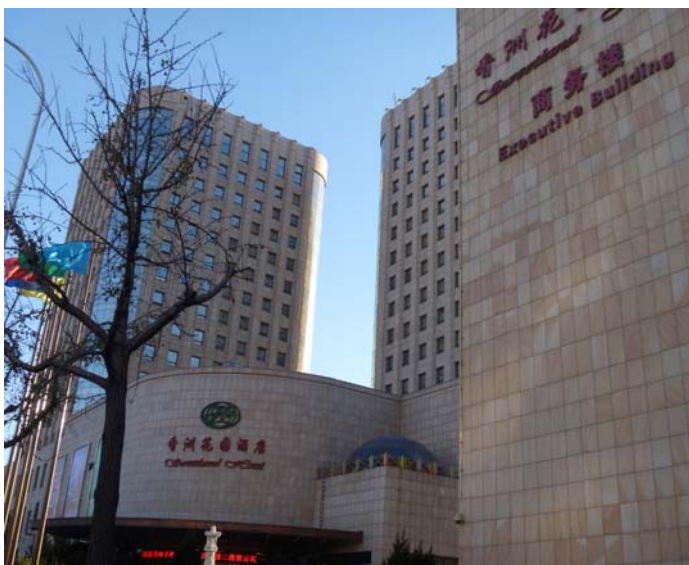
大連香洲花園酒店外観

中国市場への事業展開を商工会議所と模索するなか、大連チャレンジショップに出展したことで、かねてからの有望案件であった中国上場企業との間で商談が具体化。同社と販売代理契約を締結することで、中国各地での販売活動を開始するなど、本格的な中国市場参入を果たした。