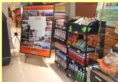
日本食スーパー「FRESHNESS 生鮮館」でも小売販売