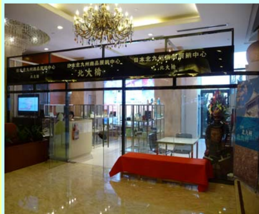
チャレンジショップ（ホテルロビーからの外観）