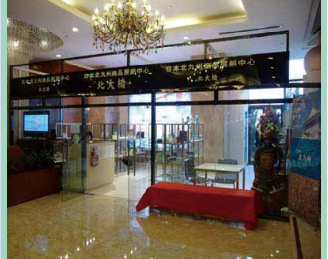
大連チャレンジショップ（ホテルロビーからの外観）

「大連チャレンジショップ」として現地の展示会・商談会に出展しますので、出展者に代わって商品をPRすることができます。