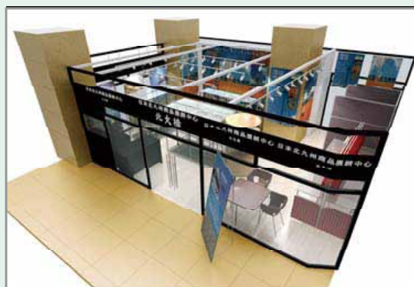
大連チャレンジショップ鳥瞰図