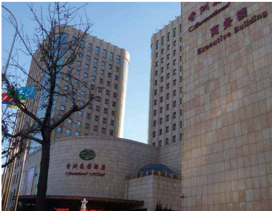
大連香洲花園酒店外観

中国市場への事業展開を商工会議所と模索するなか、大連チャレンジショップに出展したことで、かねてからの有望案件であった中国上場企業との間で商談が具体化。同社と販売代理契約を締結することで、中国各地での販売活動を開始するなど、本格的な中国市場参入を果たした。