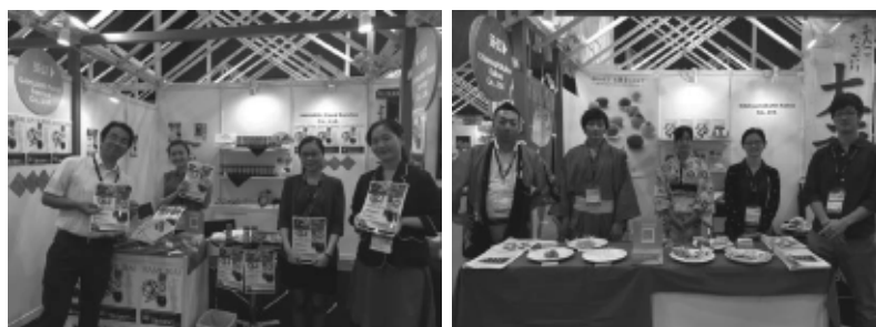
ブース前にて出展企業とグローバル人材

開始前は緊張感が高まっていたようでしたが、始まると笑顔が見え、日に日に英語の発音がよくなったり、対応がスムーズになったりと、特に高校生は確実に数日間で成長している姿を垣間見ることができました。大学生は通訳の方々の言い回しや他のブースを見て、対応を適宜変え、その英語の言い回し、対応の仕方等を高校生二人がお手本にしている、という良い関係性が出来ていました。