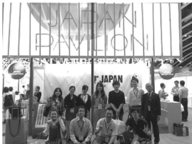
ジャパンパビリオンでの全体写真